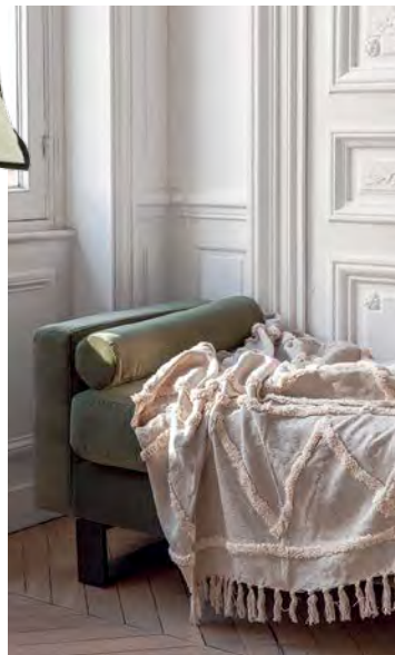
Velours-Récamiere „Midnight“, 1299 Euro. www.nvgallery.com