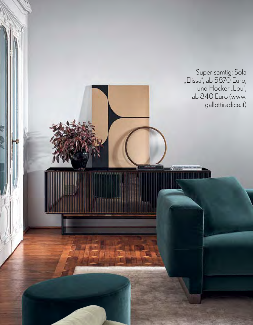
Super samtig: Sofa „Elissa“, ab 5870 Euro, und Hocker „Lou“, ab 840 Euro (www.gallottiradice.it)