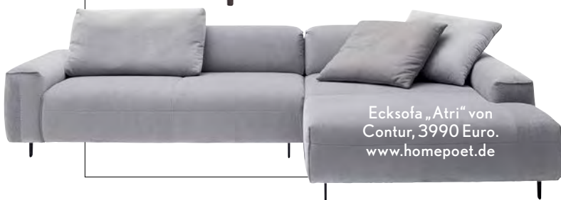
Ecksofa „Atri“ von Contur, 3990 Euro. www.homepoet.de