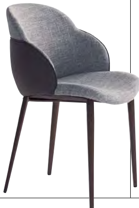
Leder und Stoff zeigt „My Way“, Preis auf Anfrage. www.bonaldo.com