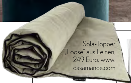
Sofa-Topper „Loose“ aus Leinen, 249 Euro. www.casamance.com